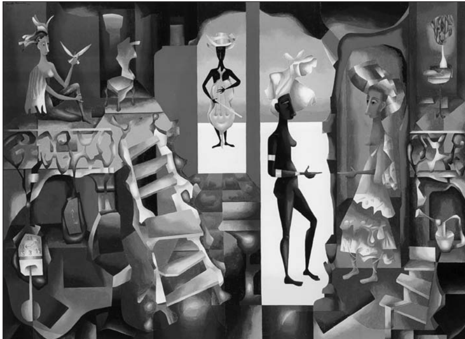
Lunes 21 de diciembre.

12 MERCOSUR, Mercado Común del Sur (Argentina, Brasil, Paraguay, Uruguay).